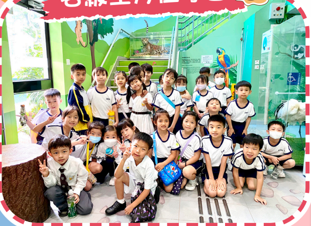
一年級參觀香港動植物公園。