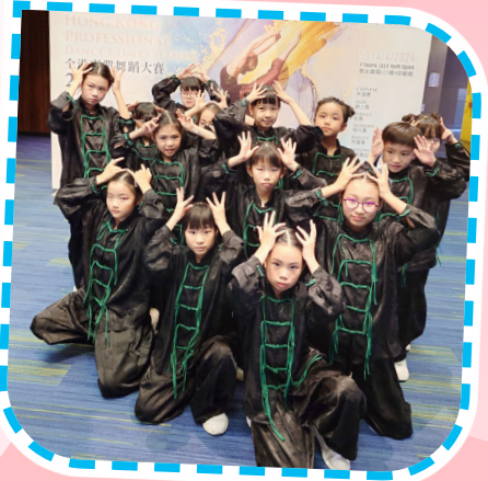
Hip Hop Jazz 校隊——全港專業舞蹈大賽 (街舞組)