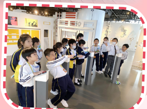
三年級參觀公民教育資源中心。