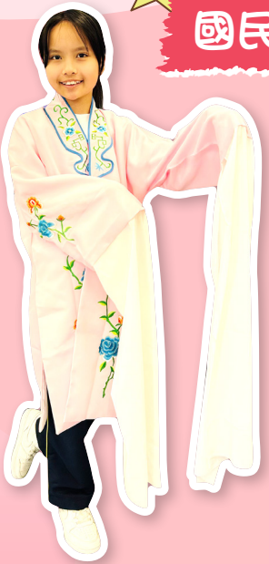
粵劇音樂研習，從華麗的服飾開始。