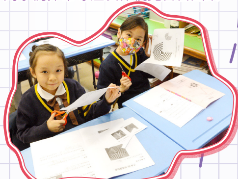
我們即將完成懸浮方塊了！