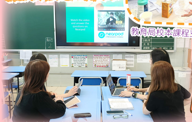
語文教學支援組英文科校本支援計劃會議。