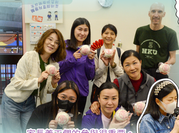
家長義工們的參與很重要。