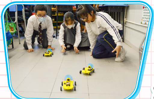
大家細心觀察風力車移動的流暢性和速度。