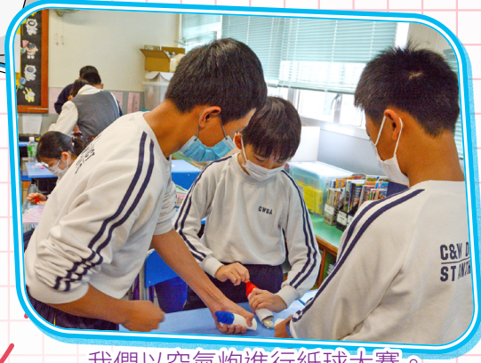
我們以空氣炮進行紙球大賽。