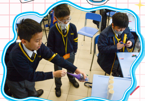
同學在測試空氣炮的射擊力。