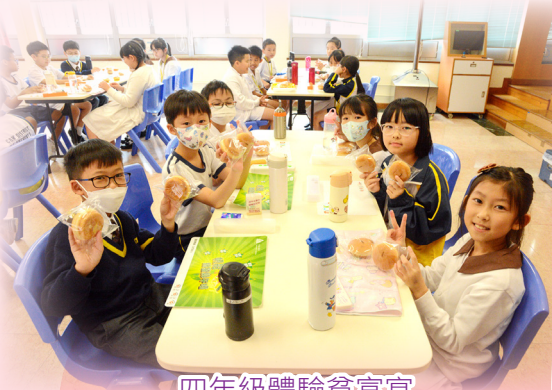
四年級體驗貧富宴