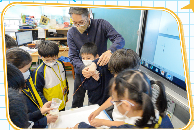
老師指導學生如何讓水珠沿棉線滑到紙杯。