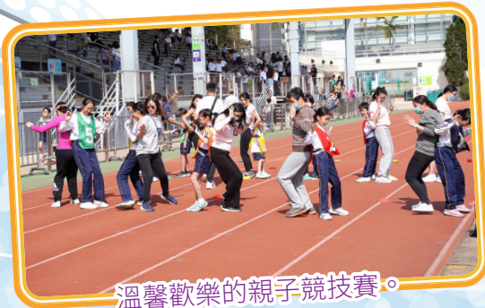
溫馨歡樂的親子競技賽。