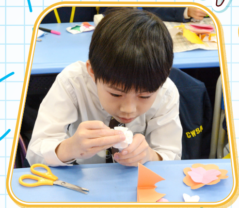
同學非常專注製作紙花。