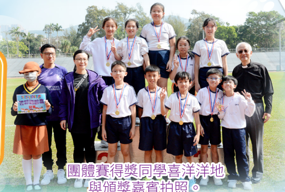
團體賽得獎同學喜洋洋地與頒獎嘉賓拍照。