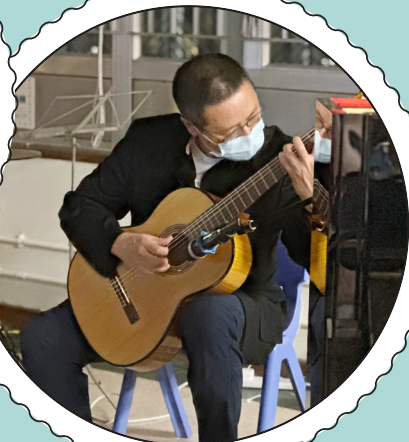
鄧主任為大家送上一曲。