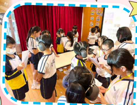
四年級賽馬會眾心行善義工推廣校園夥伴計劃——義工訓練。