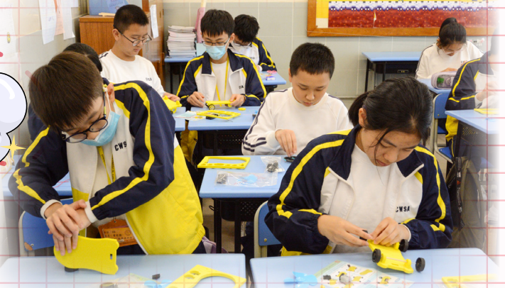
同學們努力製作電動風力車。

認識空氣佔有空間，空氣炮如何在空氣中震動和傳播以及牛頓第三定律：「作用力」等於「反作用力」。