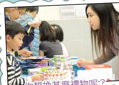
你想換甚麼禮物呢？