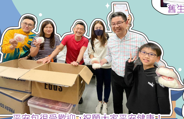
平安包很受歡迎，祝願大家平安健康！