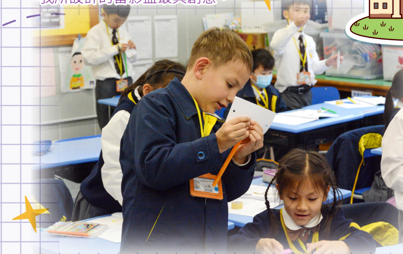
科學探究固然重要，互相學習亦很珍貴。