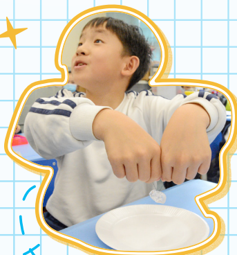
我們將鹽撒在冰塊上，再用棉線吊起冰塊。