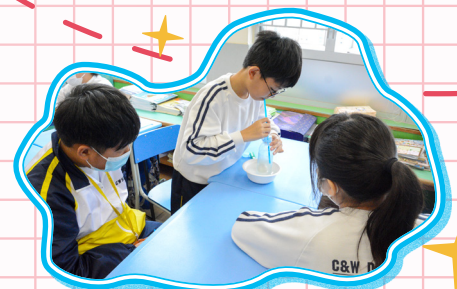
我利用吸管吸氣，發現乒乓球跟着水面上升。