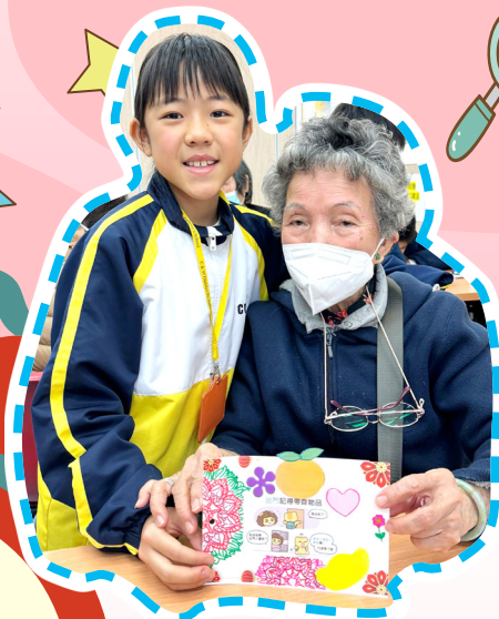
四年級賽馬會眾心行善義工推廣校園夥伴計劃——探訪老人院。