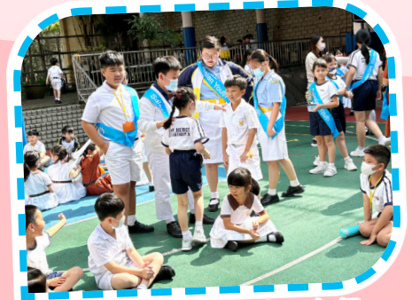
慈青大哥哥姐姐與二年級弟妹妹玩集體遊戲。