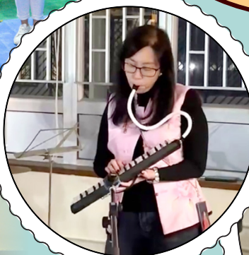
劉副校長的演出屢獲讚賞。