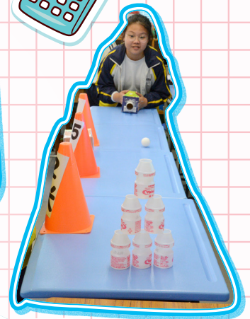
同學在測試空氣箱的射程。