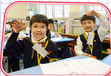
只要輕輕一拉，幻影便會出現。