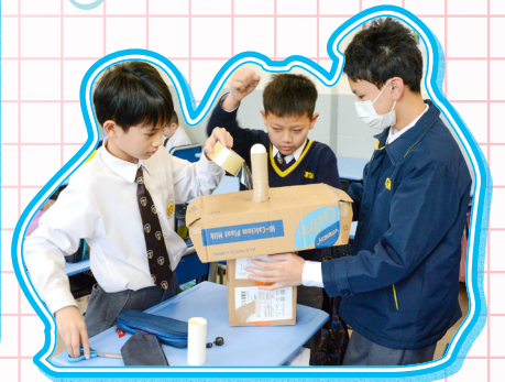
大家同心協力設計空氣箱。