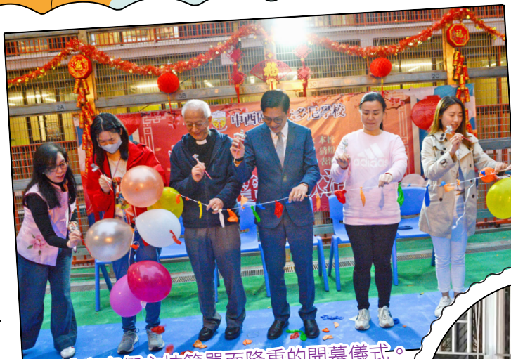
主禮嘉賓們主持簡單而隆重的開幕儀式。

久違了的「元宵燈謎晚會」本年度載譽歸來！眾師生、家長和校友濟濟一堂，度過了一個愉快的晚上。