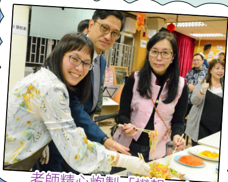
老師精心炮製「撈起」！