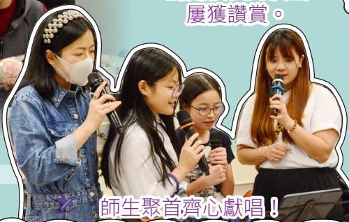
師生聚首齊心獻唱！