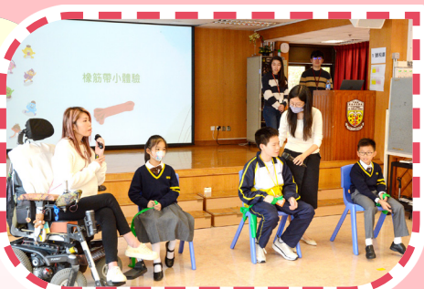
五年級參與「無障礙行者」真人圖書交流活動。