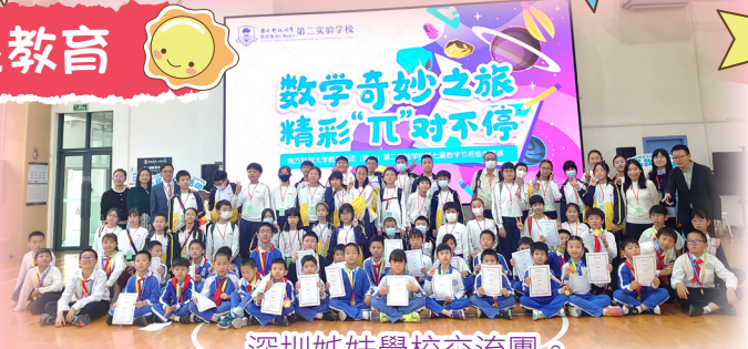
深圳姊妹學校交流團。