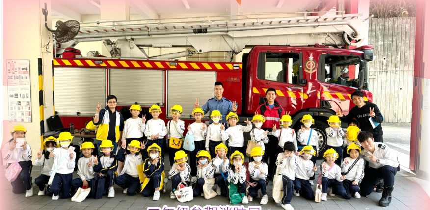
二年級參觀消防局。