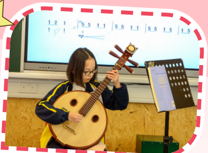
中國樂器 Busking，午間阮樂演奏。