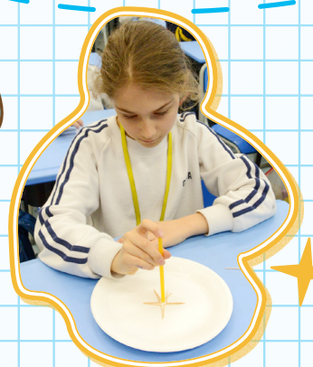
我們利用日常物品理解水的表面張力。