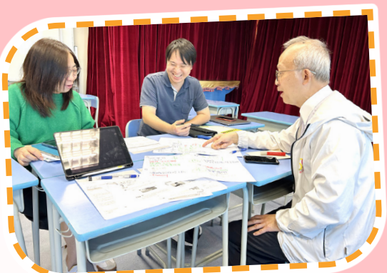
中文大學「促進實踐社群以優化小班教學」STEAM 支援計劃 (中層管理) 會議。