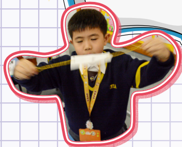
每秒轉 10 次才會出現視覺暫留。