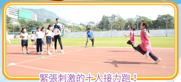
緊張刺激的十人接力跑！