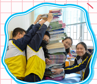
看！我們的氣球力大無窮！