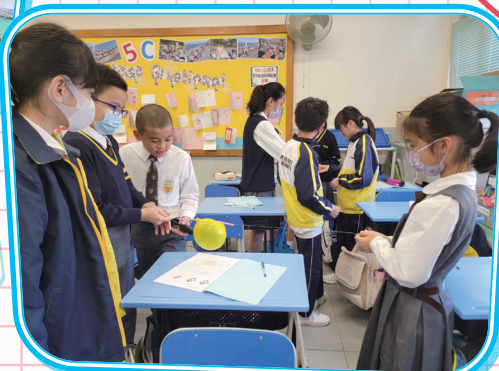
我們的設計讓氣球沿着繩子像箭一般向前衝。