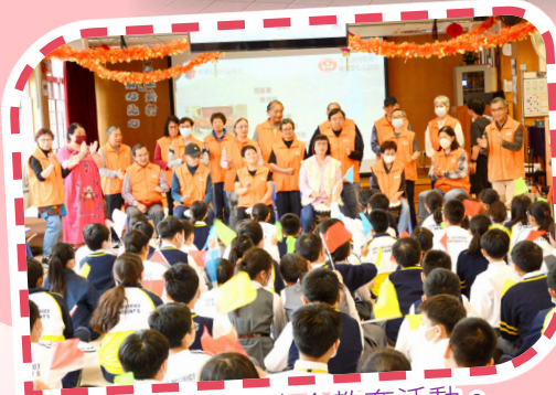
六年級參與生命教育活動。