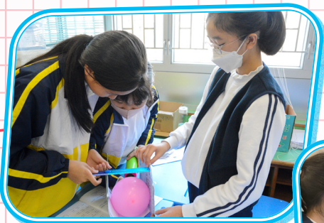
我們很認真進行實驗呢！