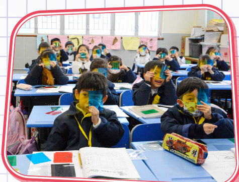
哦！原來這就是 3D 電影的原理。