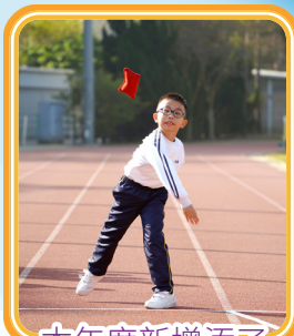
本年度新增添了擲豆袋項目。

本屆運動會一如以往，得到家長們的鼎力支持，家校合作無間，加上老師及職工上下一心，學生們的積極參與，一起造就了精彩的半天。而本屆運動會亦是學校有史以來最熱鬧的運動會，因為二年級的學生也能參與其中，享受體育競技的樂趣。