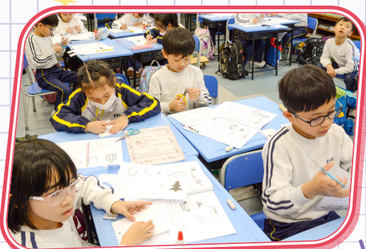
同學們非常專注製作視覺暫留圖案。