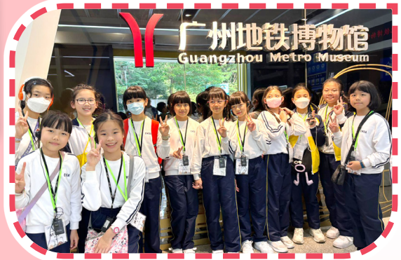
粵港澳大灣區城市探索之旅——廣州智慧城市建設。