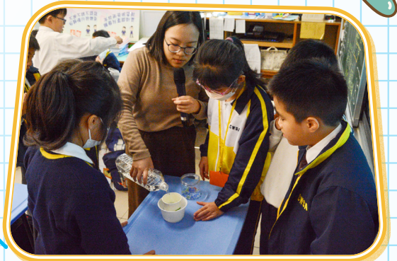
我們在測試要加多少波子才能讓水溢出？