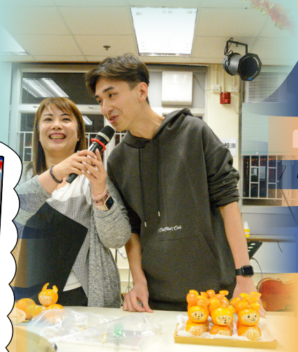
老師們製作的美點很可愛！