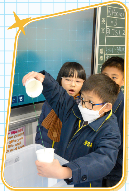
嘩！為甚麼水珠可以沿着棉線溜到另一個紙杯呢？