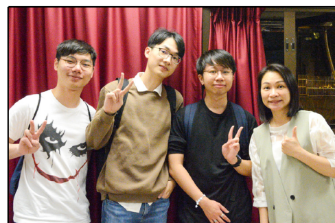
舊生們專誠回校跟老師共聚好時光。