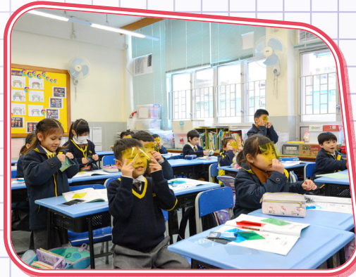
快來看看我的 3D 眼鏡。