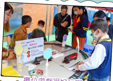
攤位遊戲很好玩呢！