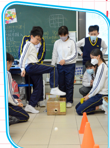
我們的空氣箱多厲害！