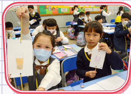
我所設計的留影盤最具創意。