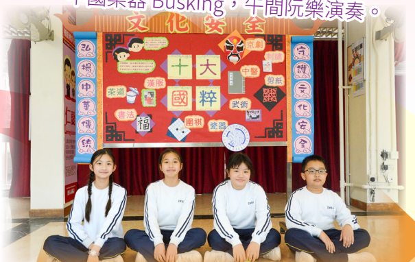
國民教育壁報設計，維護國家文化安全。